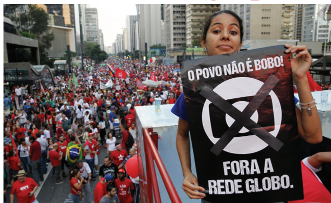
Rede Globo faz campanha descarada pelas Reformas da Previdência e Trabalhista

2. Os golpistas também querem desvincular o piso da previdência do salário mínimo. Para eles, os aposentados e pensionistas devem receber menos que o mínimo, uma vez que a desvinculação leva, fatalmente, a um piso inferior. Como a valorização do salário mínimo nos governos Lula e Dilma possibilitou 77% de aumento real, essa gente defende que esta política de recuperação deixe de existir.