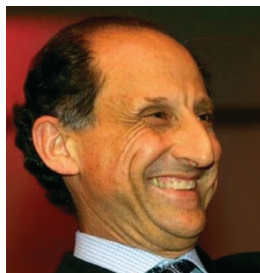
Skaf e Alckmin : pelo retrocesso

Nunca vamos esquecer que já tentaram concretizar esse assalto aos trabalhadores no governo de Fernando Henrique Cardoso (FHC) em 2001. Foi Lula que acabou com essa pouca vergonha.