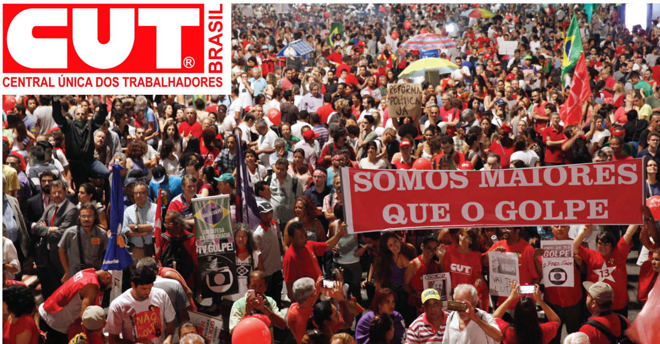
De Norte a Sul do país, centenas de milhares tomam as ruas em defesa da democracia