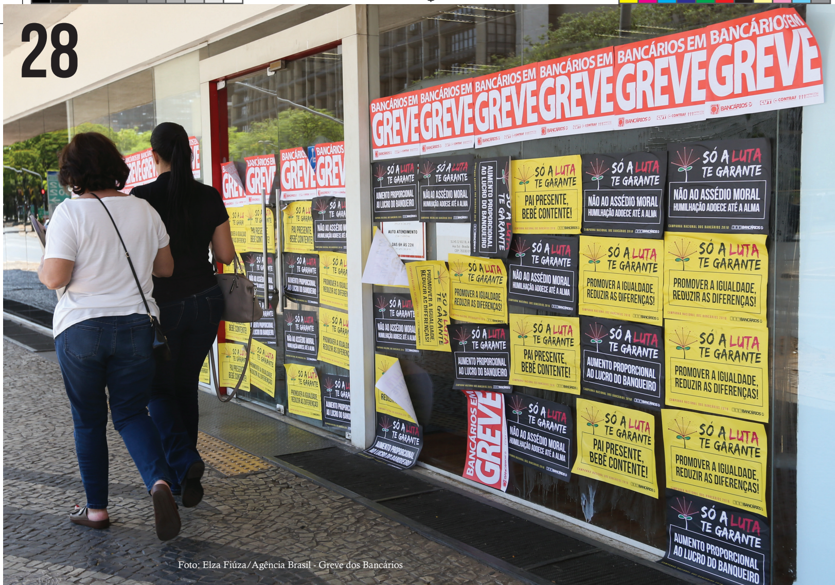
Greve dos Bancários

cada na regulamentação das condições de trabalho da categoria. Ainda que, até hoje, sigam existindo formalmente duas mesas de negociação com a Fenaban, sendo uma com a Contec e outra com o Comando Nacional dos Bancários, é nessa última onde a negociação de fato ocorre dada a representatividade do Comando que abrange quase 90% da categoria bancária.