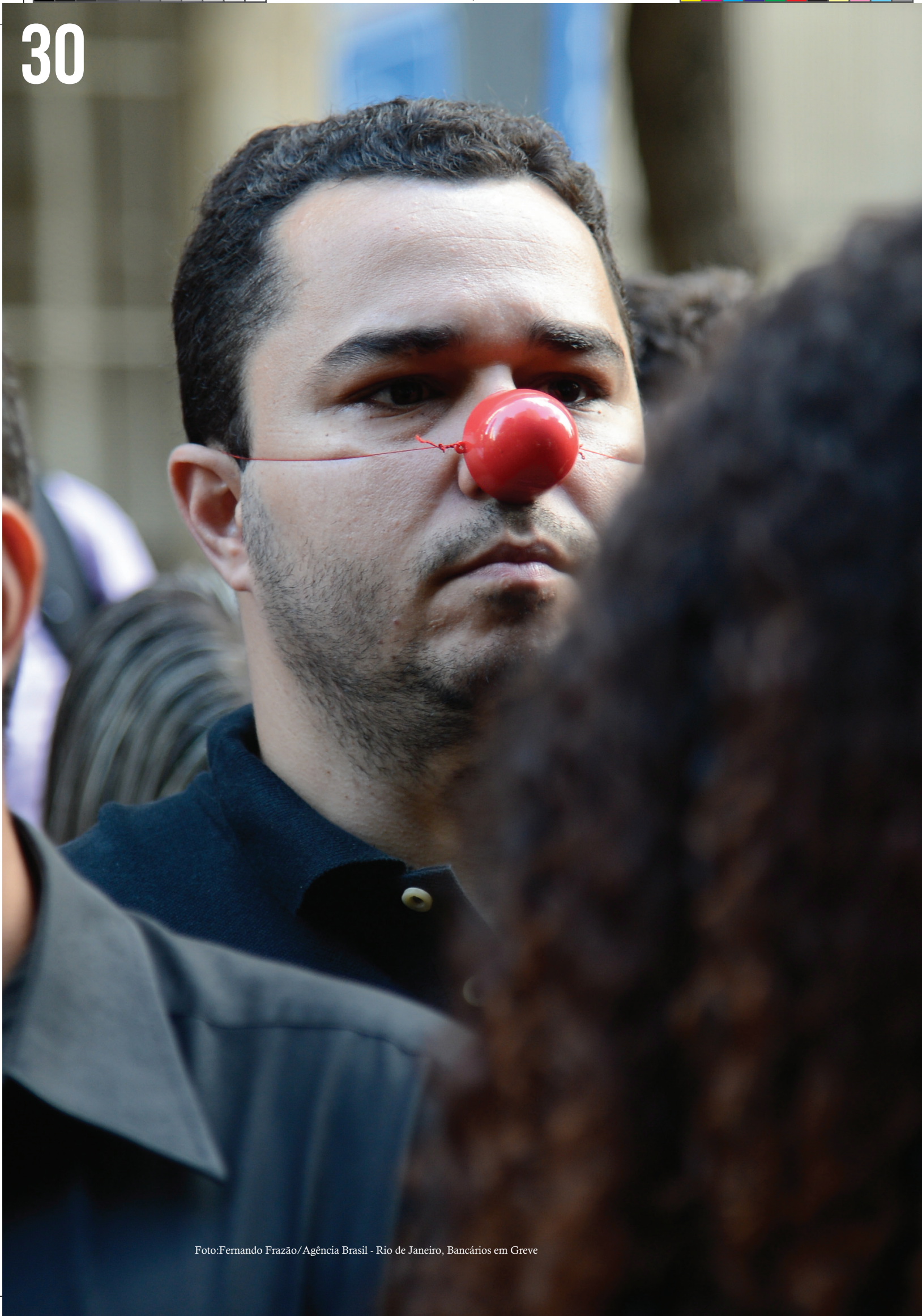
Rio de Janeiro, Bancários em Greve