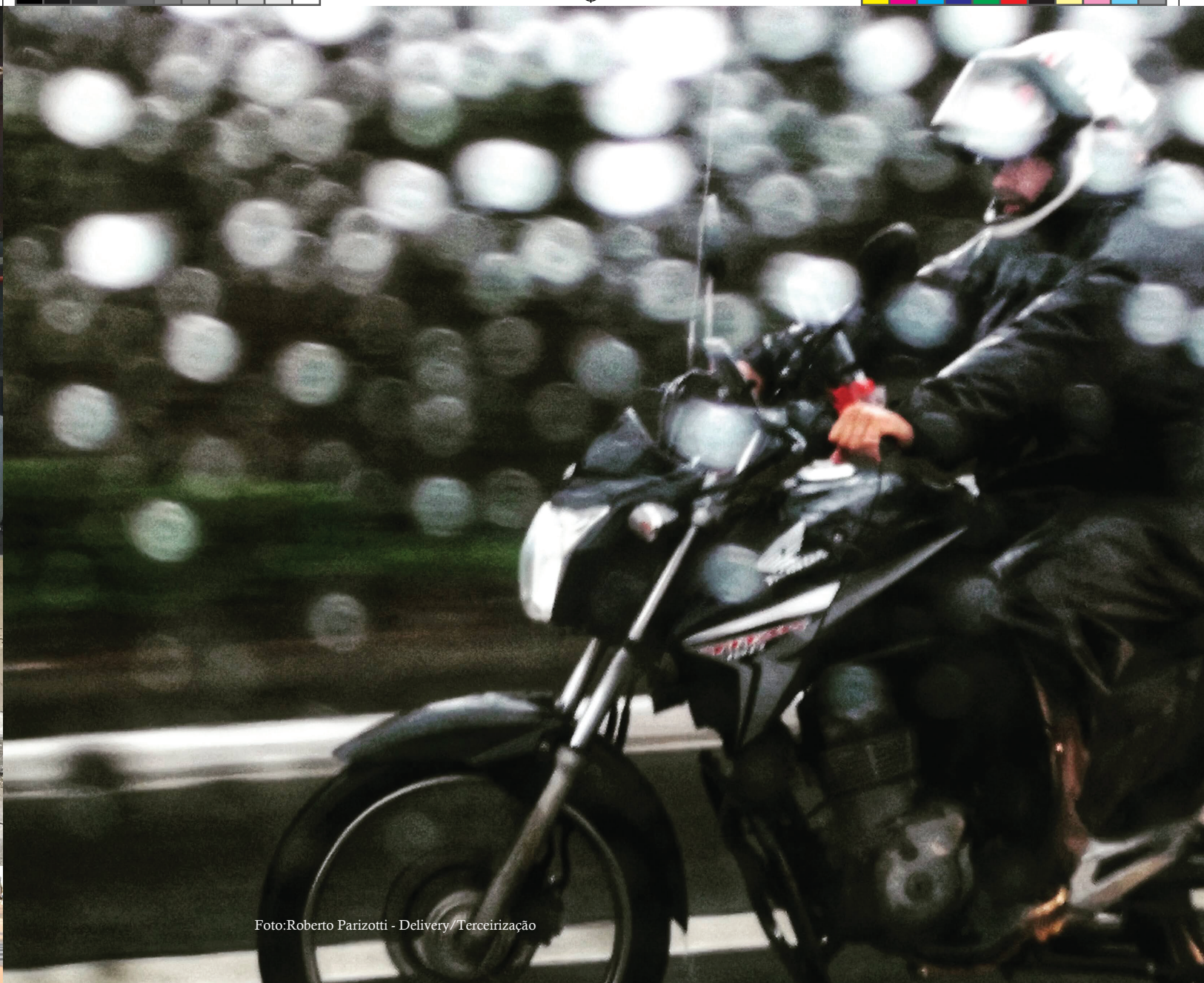
Delivery/Terceirização

A política econômica está errada e isso é um conjunto de reflexões que o MSI tem feito e, no caso da negociação coletiva, não estamos nesse estágio ainda. O nosso estágio é da criação da confederação nacional dos trabalhadores da indústria da CUT, aprovada no 13º CONCUR por uma resolução e reafirmada em Plenária da CUT, em 2021.