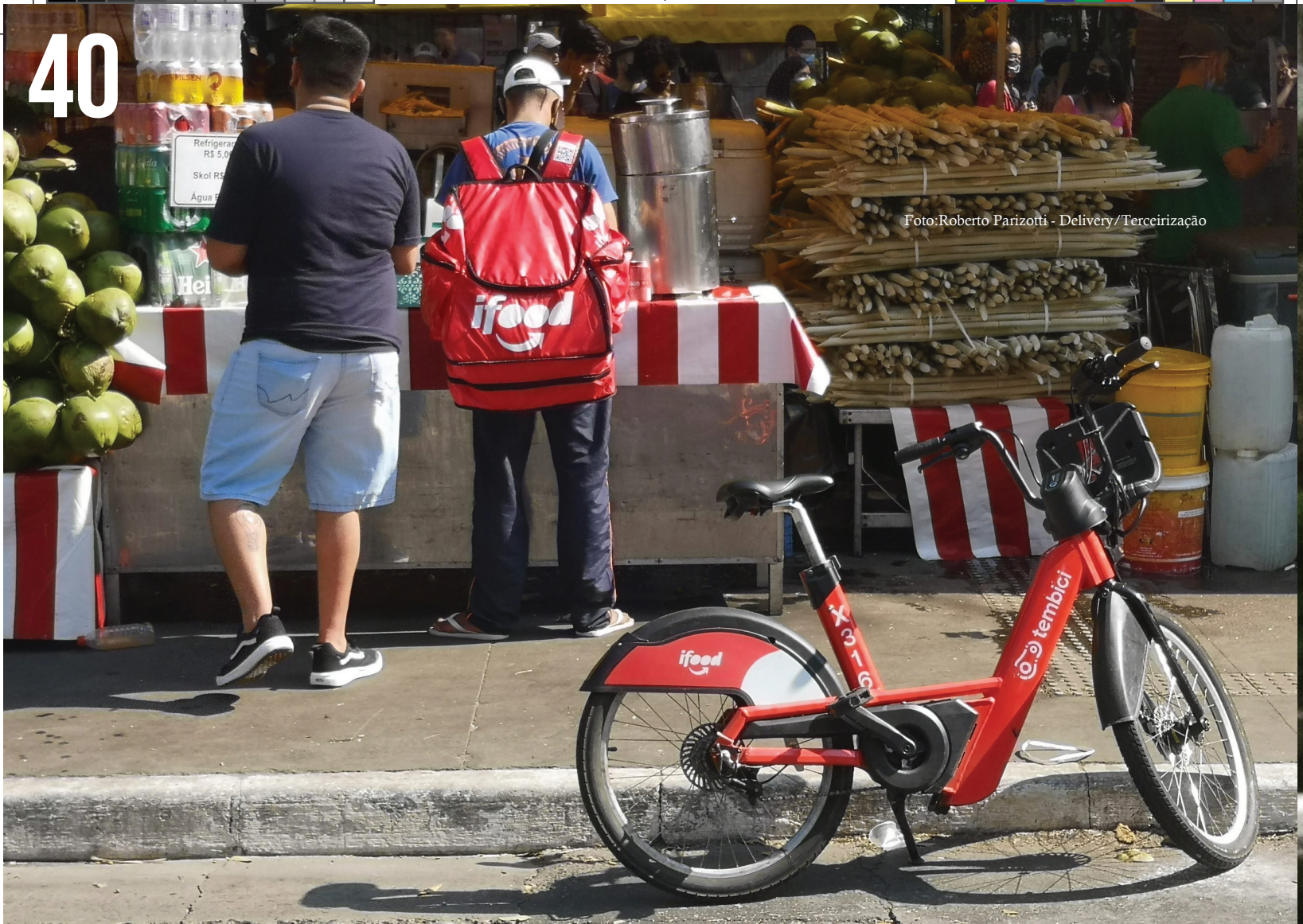
Delivery/Terceirização