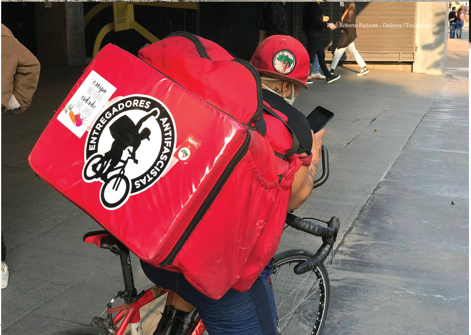
Delivery/Terceirização