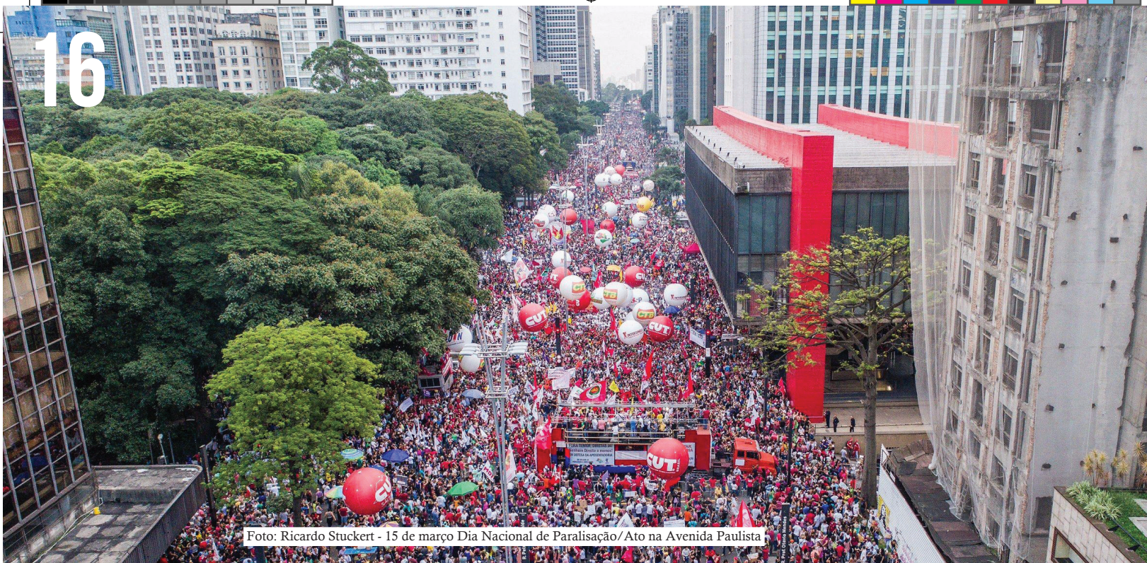
15 de março Dia Nacional de Paralisação/Ato na Avenida Paulista

O Brasil nunca teve uma legislação que assegurasse a ultratividade, salvo no curto espaço de tempo entre 1992 e 1994, com a chamada Lei Barelli (Lei n. 8.542/92) que dizia: “Art 1º, parágrafo 1º - As cláusulas dos acordos, convenções ou contratos coletivos de trabalho integram os contratos individuais de trabalho e somente poderão ser reduzidas ou suprimidas por posterior acordo, convenção ou contrato coletivo de trabalho”. Essa Lei foi suprimida no Plano Real.