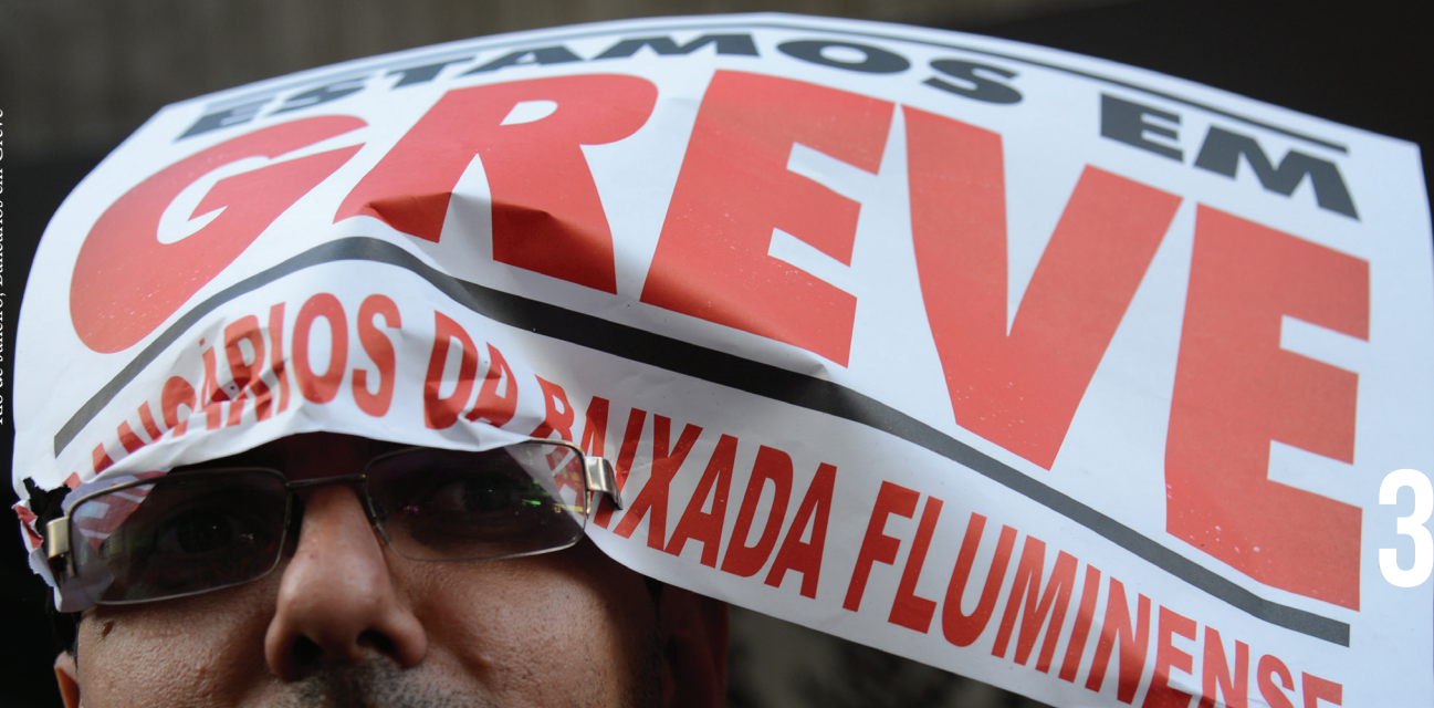
Rio de Janeiro, Bancários em Greve

O contexto de crise econômica, de ataque às organizações dos trabalhadores e de novos arranjos produtivos demandará estratégias renovadas por parte do sindicalismo, a fim de manter seu grau de protagonismo na regulação das relações de trabalho e na própria construção de um país mais justo e inclusivo, com desenvolvimento econômico, social e ambiental. É, justamente, diante deste desafio que a experiência de organização e negociação do sindicalismo da categoria bancária pode apontar caminhos a serem seguidos pela classe trabalhadora.