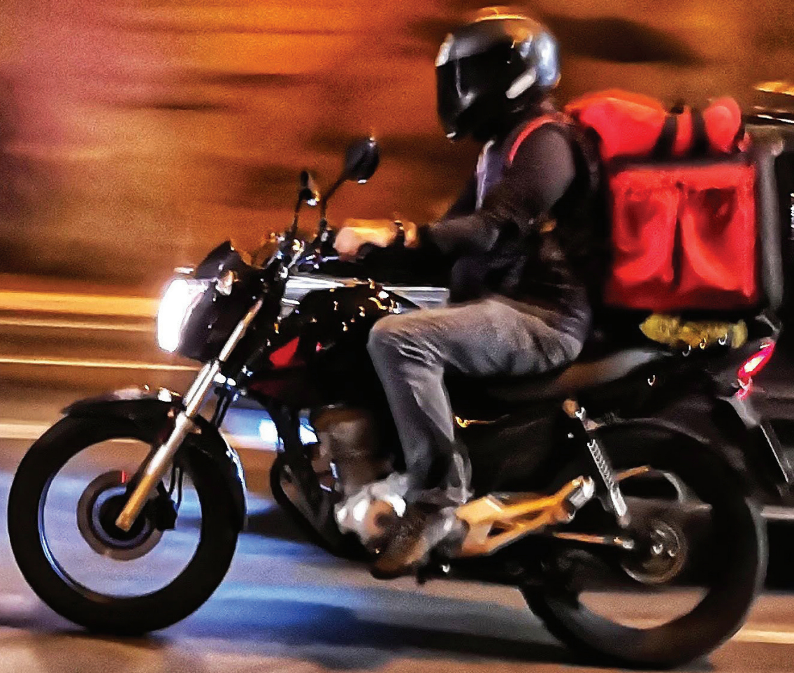
Delivery/Terceirização